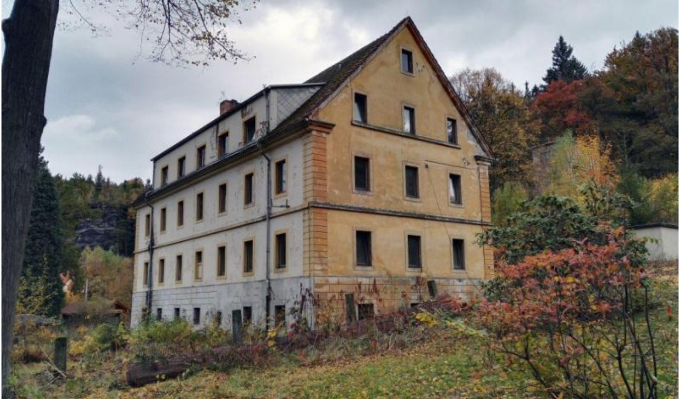
Biedermeierhaus Ansicht vom zukünftigen Pavillon.jpg