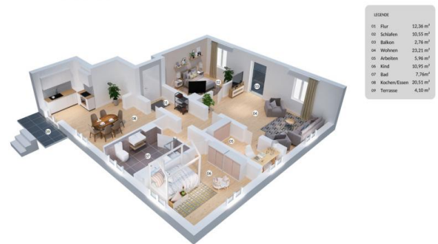
WE 1 in 3D